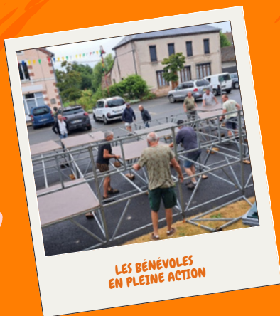
LES BÉNÉVOLES EN PLEINE ACTION