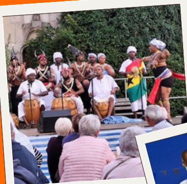
GROUPE DU GHANA

Les performances du groupe sont principalement axées sur la danse. Chaque danse est une cérémonie en soi, représentant les célébrations africaines, mettant en valeur et invoquant des pratiques ancestrales colorées et pleines de symbolisme emmenées par des percussions époustouflantes. Quel plaisir de voir ces danseurs, chanteurs, musiciens déployer une énergie folle sur scène, avec une joie et un plaisir communicatif pour le plus grand bonheur des spectateurs. Le public a même rejoint les membres du groupe sur scène pour un dernier moment festif.