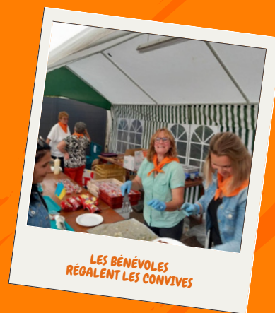
LES BÉNÉVOLES RÉGALENT LES CONVIVES

Que ce soit les bénévoles, les familles d'accueil, tout notre petit village s'est mobilisé pour faire passer un bon moment à ces jeunes et essayer de leur faire oublier quelques instants la situation dramatique dans laquelle ils se trouvent. Nous sommes certains que de nombreux souvenirs resteront gravés dans nos mémoires. Nous sommes toujours en contact avec certains membres du groupe et nous leur souhaitons de retrouver la paix au plus vite. Encore un grand merci aux bénévoles, aux familles d'accueil, au public, sans vous ces soirées n'existeraient pas.