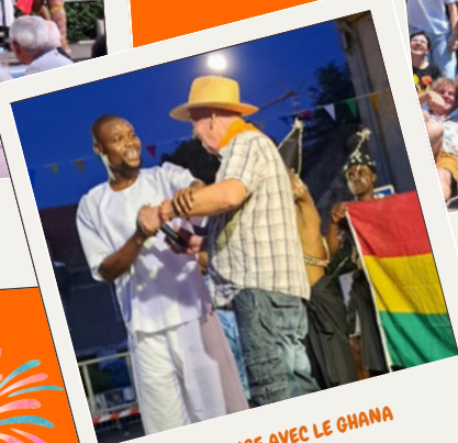
ÉCHANGE AVEC LE GHANA