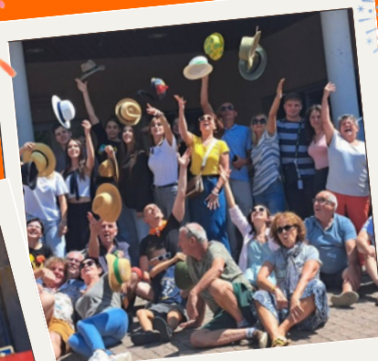
DÉPART DE NOS AMIS UKRAINIENS